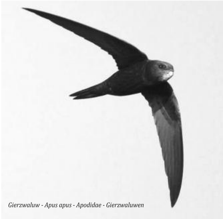
Gierzwaluw - Apus apus - Apodidae - Gierzwaluwen

Natuurpunt heeft op haar site www.gierzwaluwen.be een folder 'Gierzwaluw: vogel van steden en dorpen' met tips over nestkasten, inbouwstenen en dakpannen die kunnen helpen gierzwaluwen bij ons te houden. In tegenstelling tot huiszwaluwen maken gierzwaluwen geen troep onder hun nest, dus daarvoor moet u het niet laten. http://gierzwaluwkolonieregulerstraathaarlem.nl/ Vier rijwoningen in Haarlem (Nederland) hebben nestkasten opgehangen met webcams erin. Iets voor Sint-Andries?