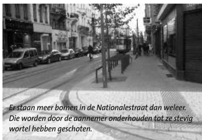
Er staan meer bomen in de Nationalestraat dan weleer. Die worden door de aannemer onderhouden tot ze stevig wortel hebben geschoten.