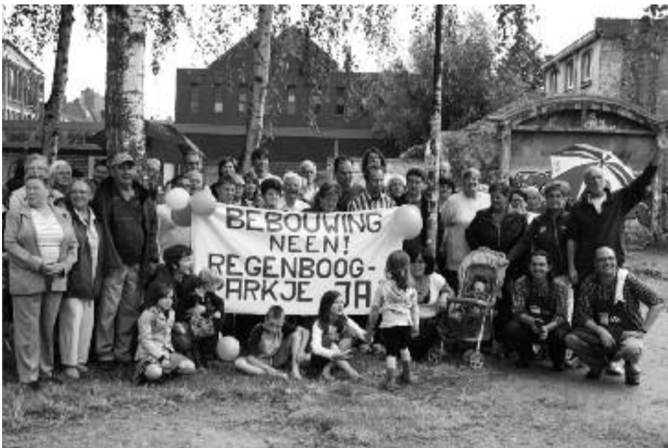
Actie voor behoud van het Munthof