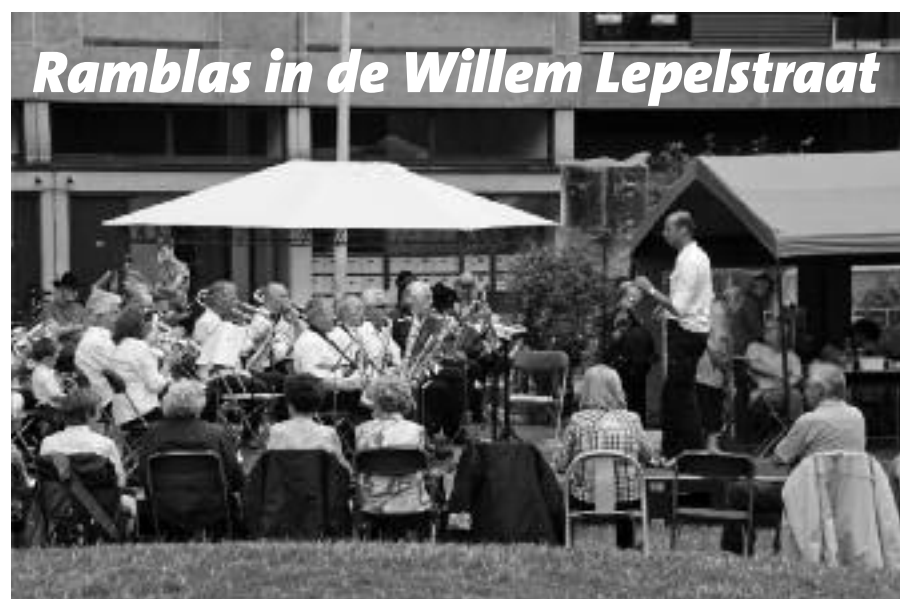
Rambblas in de Willem Lepelstraat

gen die graag van deze gemeenschapsvoorziening willen gebruiken maken. Maar jammer genoeg