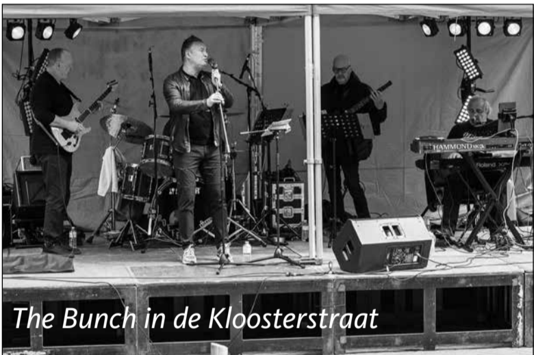
The Bunch in de Kloosterstraat