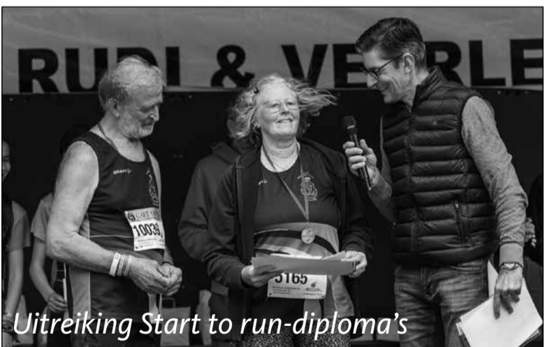
Uitreiking Start to run-diploma's