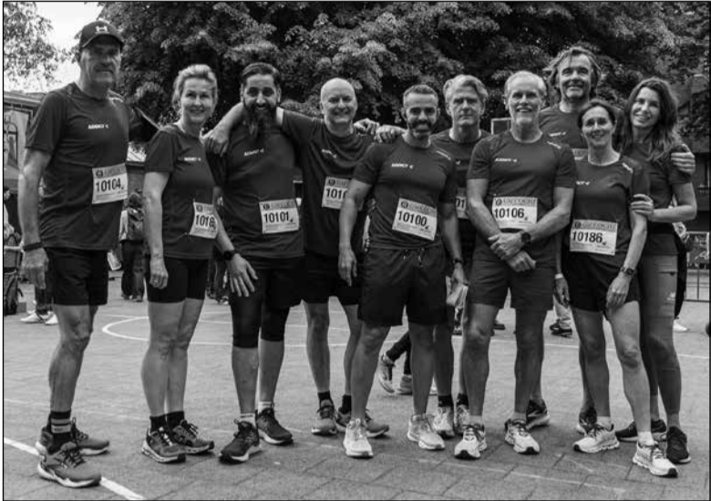
Diverse ploegen profiteerden van de aanwezigheid van onze huisfotograaf, Gert Vermeersch, om een leuke groepsfoto te maken.