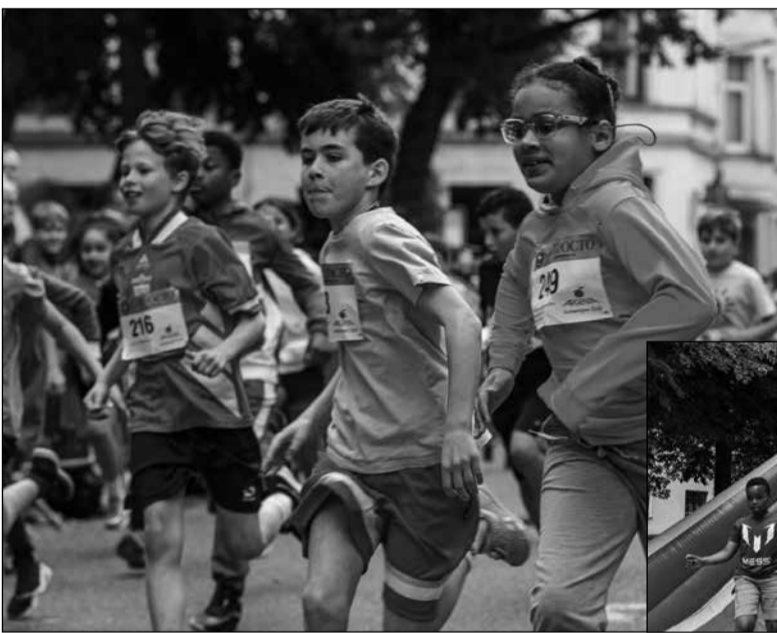
Ook dit jaar waren er heel wat schoolploegen met leerkrachten en leerlingen aanwezig.