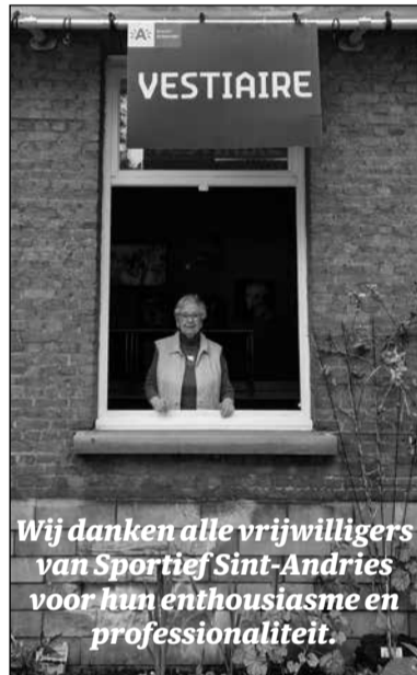
Wij danken alle vrijwilligers van Sportief Sint-Andries voor hun enthousiasme en professionaliteit.