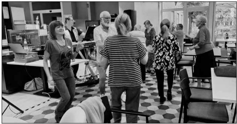
(tekst & foto's Walter Van den Bulck)